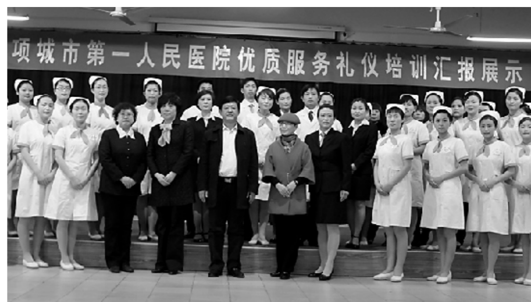
优质服务礼仪培训现场

该院不断加强新农合政策宣传和培训,利用例会会对全院中层干部进行新农合政策培训,同时在院内开辟新农合宣传专栏,进行新农合有关制度和报补注意事项的宣传,供全体职工学习。该院定期对医务人员进行新农合知识培训,培训后进行考试,确保了全体医务人员新农合基本政策知晓率达到100%。