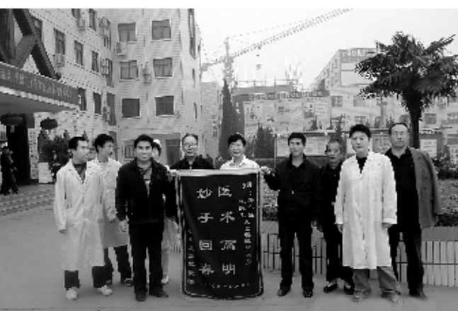
参合农民送锦旗到医院

为了满足参合患者日益增长的医疗需求,经国家有关部门审核批准,一座占地面积10万平方米、设计床位1200张的现代化大型综合医院将于2015年矗立在豫东大地。该院新院区的建设和投入使用,不仅让项城市民切实享受到国